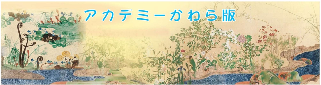
左：尾形乾山の角皿 / 右：尾形光琳「春秋草花図屏風」より構成