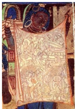
「阿闍世王の悶絶」部分 中国新疆ウイグル自治区 クチャ 6世紀頃