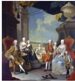
〈マリアテレジアとその家族〉

本講座では、中世におけるこの「国家」の始まりから説き起こし、近代的な民主主義や国民観に揺り動かされる20世紀初頭まで、歴史の魅力とアイロニーにあふれたハプスブルクの