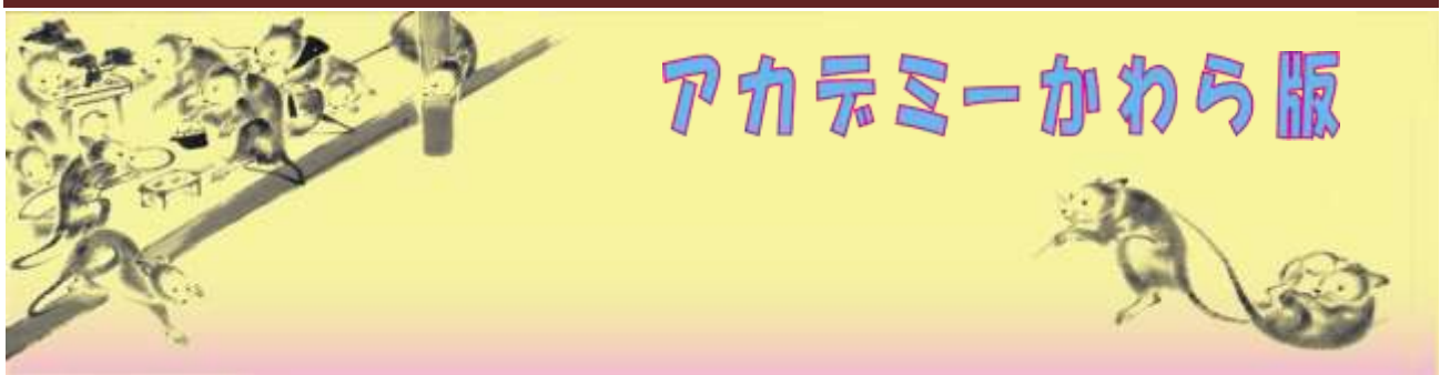
伊藤若冲 「鼠婚礼図」より構成