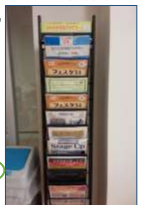
アカデミー専用ラック