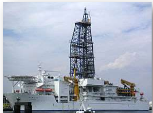
地球深部探査船 『ちきゅう』

海底下 2,500 メートルの地層の中に微生物が生きている！地下生命圏の発見と探索により、今私たちの地球生命観が大きく変わろうとしている。その最前線を拓いているのが地球深部探査船「ちきゅう」である。「ちきゅう」は海底下数キロメートルを掘削できる研究船で、これまでに南海トラフや東北日本海掘削の結果、地下微生物の中にはメタンを作り出しているモノが存在する事がわかってきた。海底下の世界は私たちが思っている以上にダイナミックで驚きに満ちあふれている。