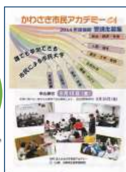
新聞折込み用チラシ