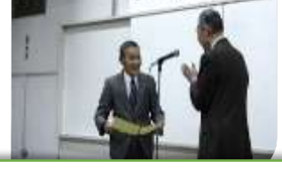
アカデミー20周年記念セレモニー 感謝状贈呈