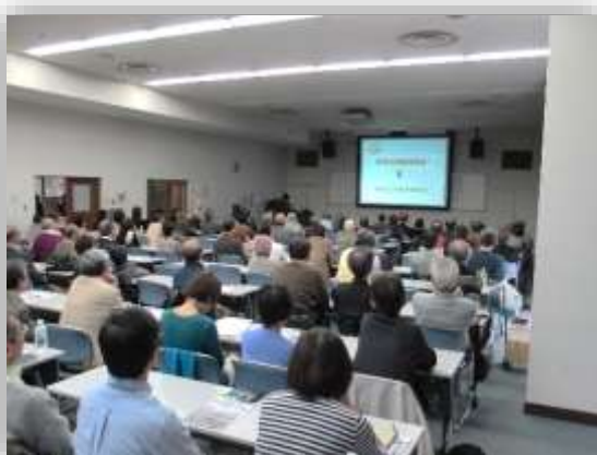
第3部：「アカデミー受講にあたってのオリエンテーション」