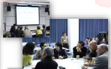
参加型アトラクション アカデミークイズ