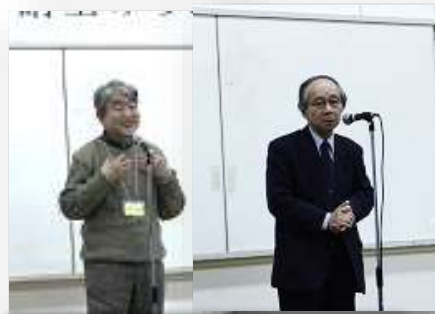
コーディネーターの先生から一言