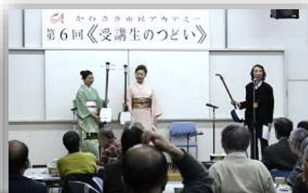
和の音楽を楽しむ～トーク&三味線コンサート