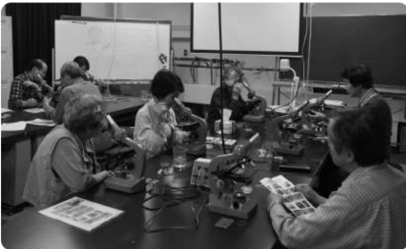
実験室での実験（左）

内容：実験と見学を中心とし必要に応じて座学も加えます。実験を通して科学の楽しさを体感するとともに、科学・技術系の諸施設を訪ねて、科学・技術の現状と未来に思いを馳せましょう。見学先は「日本科学未来館」、「理研鶴見研究所」、「第一三共くすりミュージアム」、「気象庁気象科学館」等を予定しています。