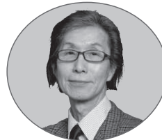
多摩美術大学名誉教授 諸川 春樹 (美術)