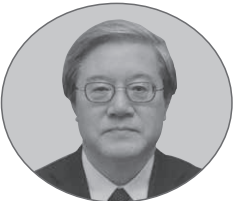
信州大学名誉教授 都築 勉 (政治・社会)