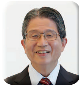
認定NPO法人かわさき市民アカデミー顧問理事 東京大学特別荣誉教授 東京理科大学荣誉教授 藤嶋 昭