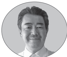
東京大学教授 蔵治 光一郎 (環境とみどり)