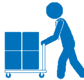
機材の搬入、セッティング